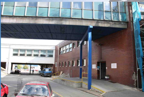
Ostrava hl. nádraží